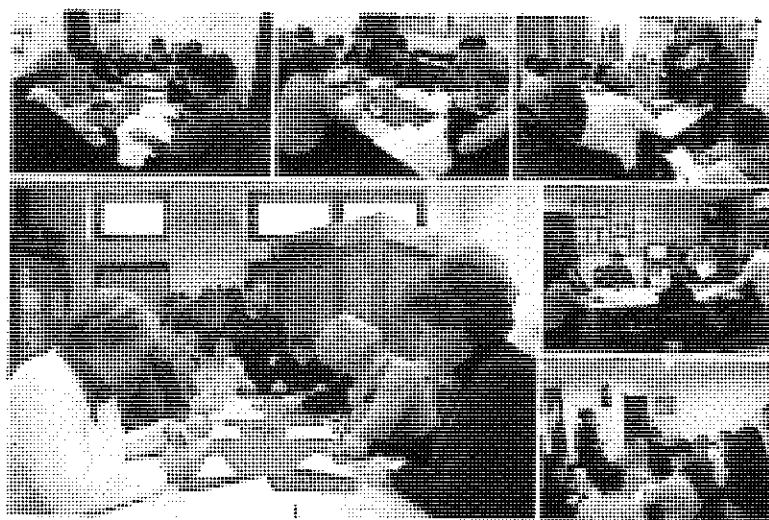
RADIONICE - DRUŽIONICE ZABORAVI ZABORAVLJANJE