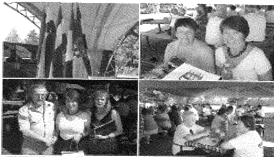
Na Međunarodnom susretu u Sloveniji - Metlika